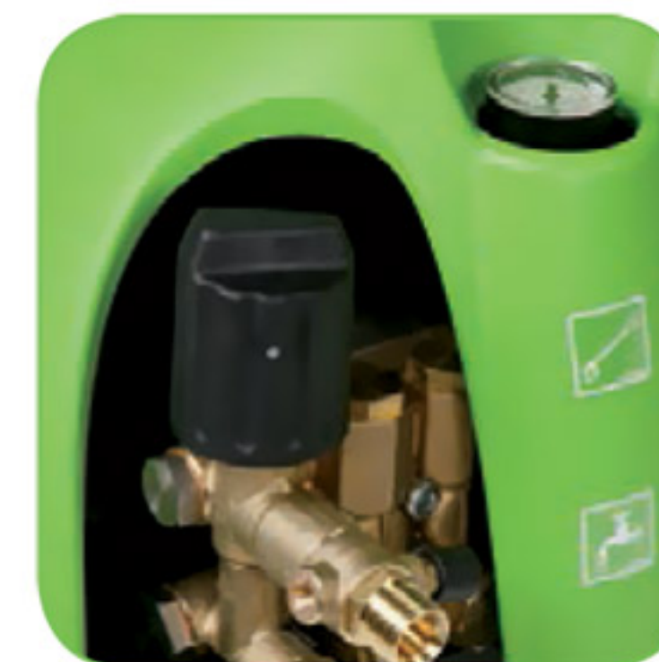
دارای پیچ تنظیم فشار آب خروجی، متناسب با میزان آلودگی