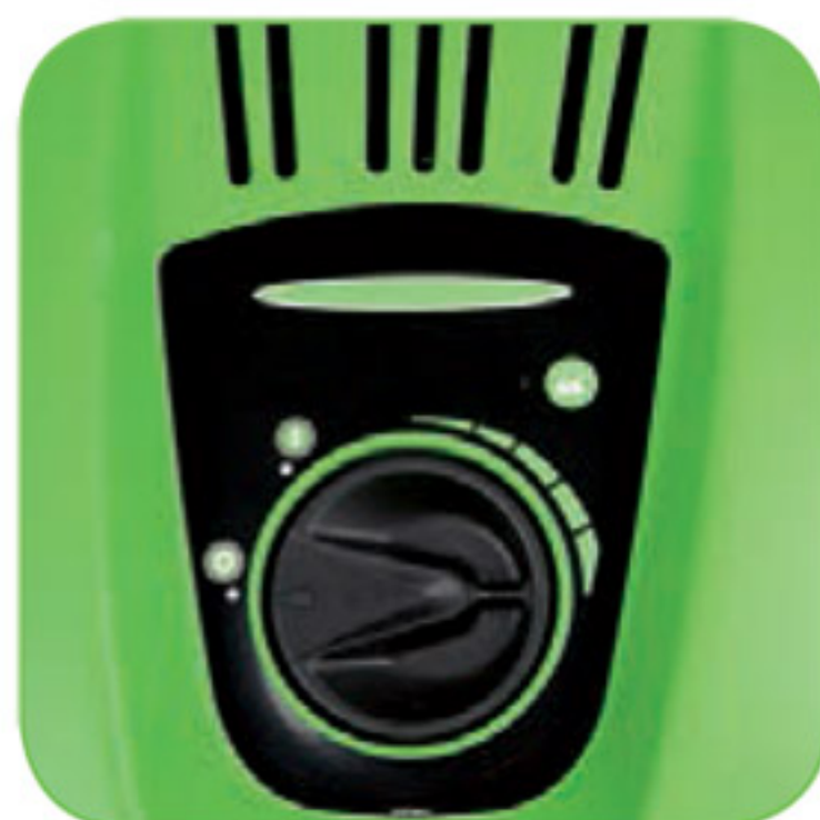
دارای پیچ تنظیم جهت کم و زیاد کردن میزان ریزش مواد شوینده