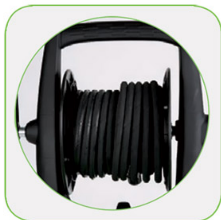
دارای فرقره شیلنگ جمع کن