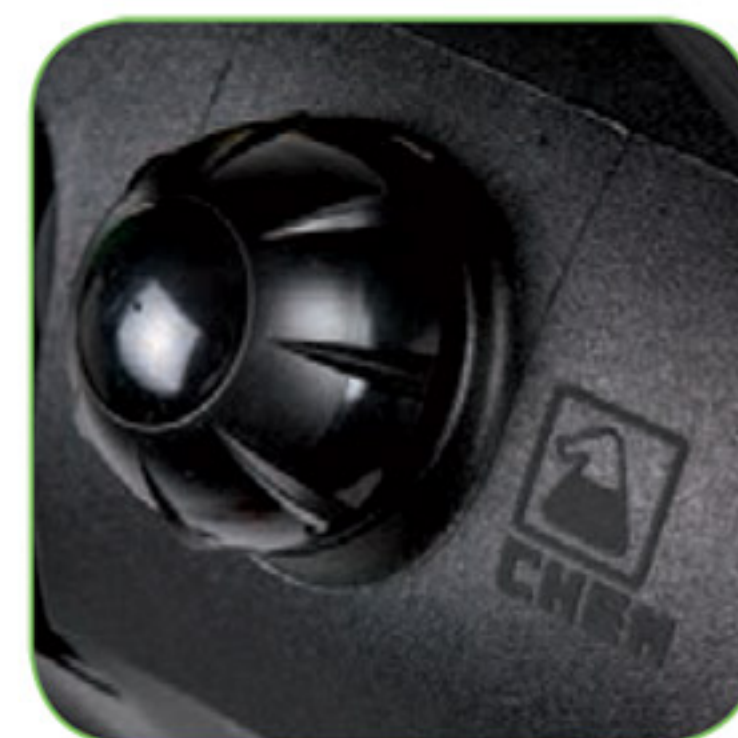
دارای مخزن مواد شوینده با ظرفیت ۲۵ لیتر