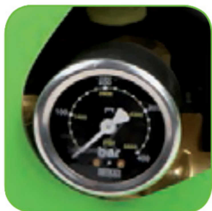
دارای نشانگر میزان فشار آب خروجی