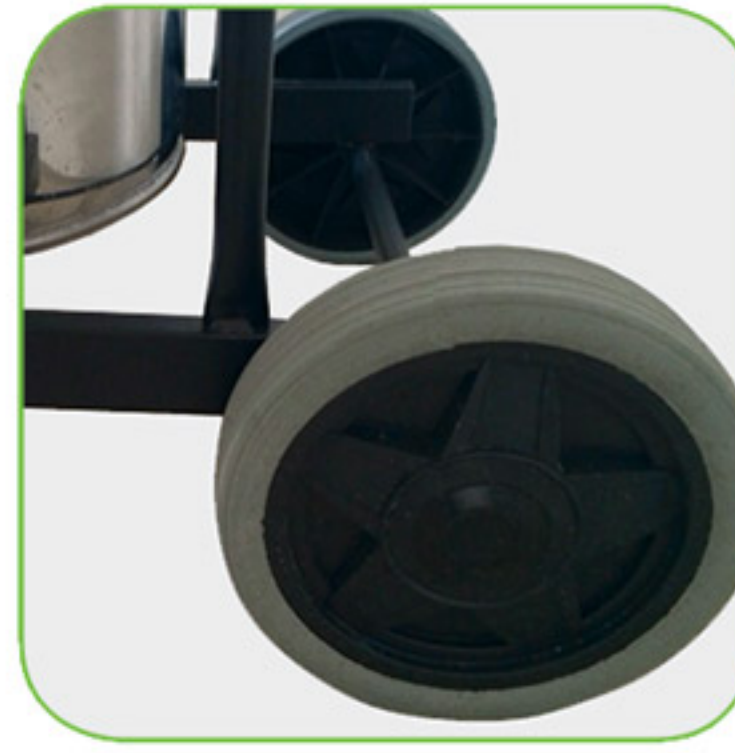
دارای چرخ های بزرگ جهت افزایش ایستایی دستگاه