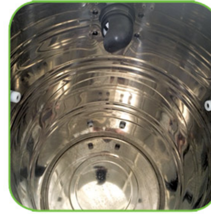
دارای مخزن زباله از جنس استیل