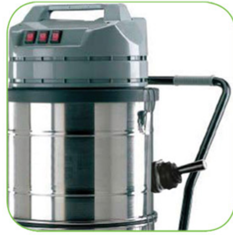
طراحی منحصر به فرد دسته دستگاه جهت جابجایی آسان