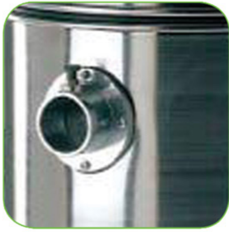
دارای قفل نگهدارنده لوله خرطومی جهت جلوگیری از اتلاف جریان مکش