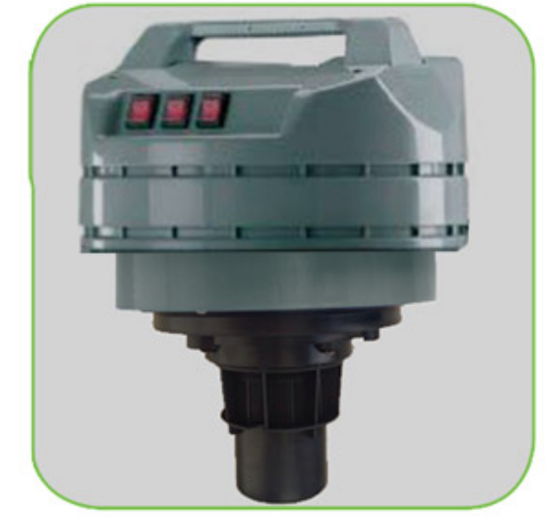
دارای شناور کنترل کننده سطح مایعات جهت جلوگیری از ورود مایعات به موتور