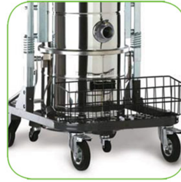
دارای سبد فلزی جهت قرارگیری لوازم جانبی دستگاه شامل انواع نازل ها و ...