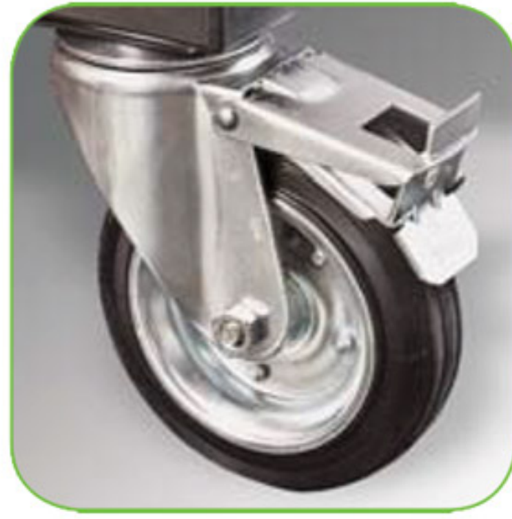
دارای چرخ های بزرگ و مجهز به قفل جهت افزایش ایستایی دستگاه