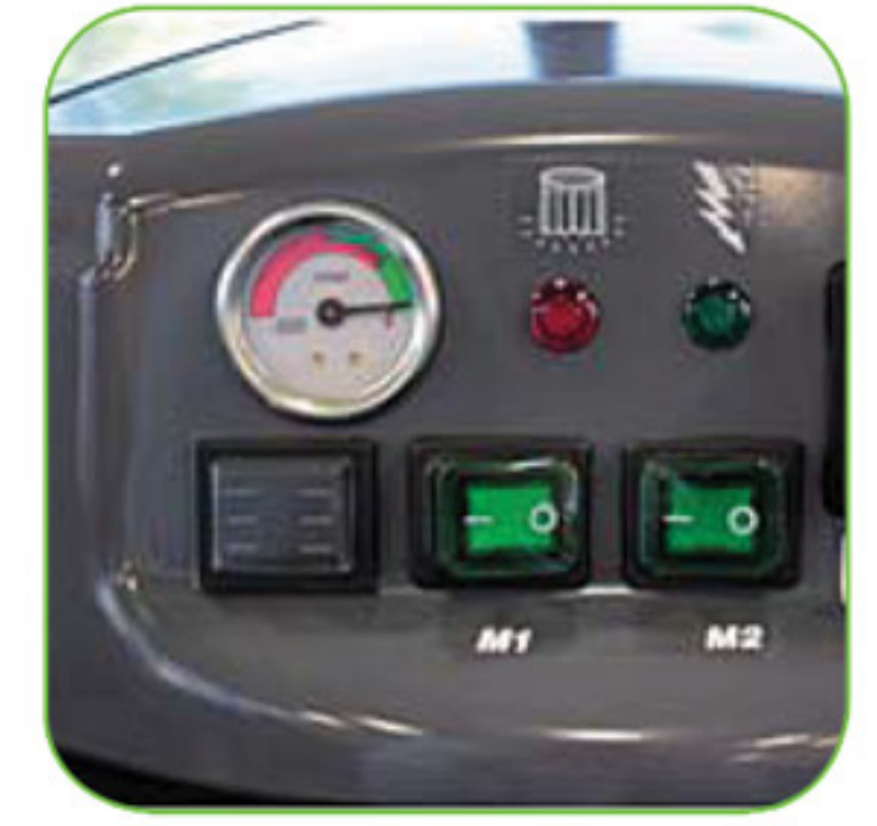
دارای بارومتر یا فشارسنج، جهت نمایش و اعلام فشار وارده بر موتور