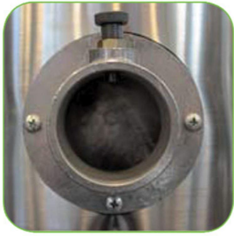
دارای دریچه ورودی لوله خرطومی از جنس فولاد