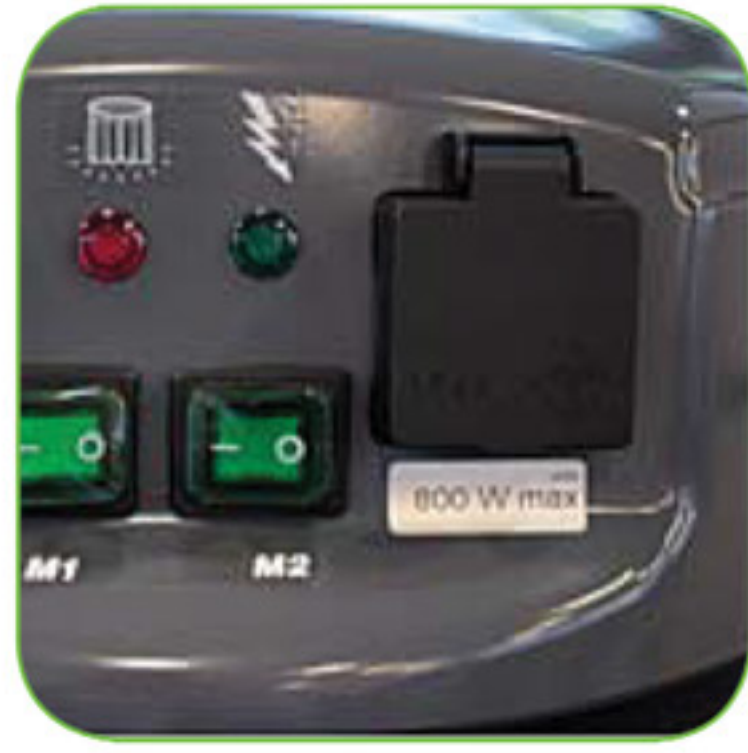
دارای پریز برق بر روی دستگاه. در صورت نیاز به استفاده از وسیله برقی دیگر